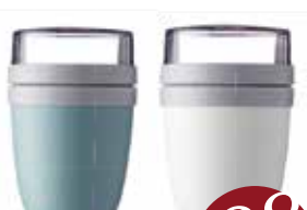
MEPAL Müslibecher to go